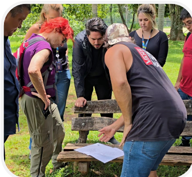
Futura pista de Pump-Track no Parque Villa Lobos