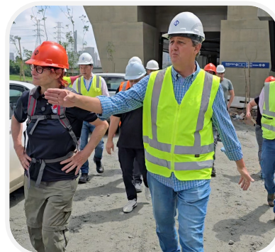
Obras de recapeamento na Ciclovia do Rio Pinheiros