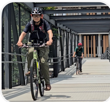
Nova Ciclopassarela de acesso à ciclovia, em Santo Amaro